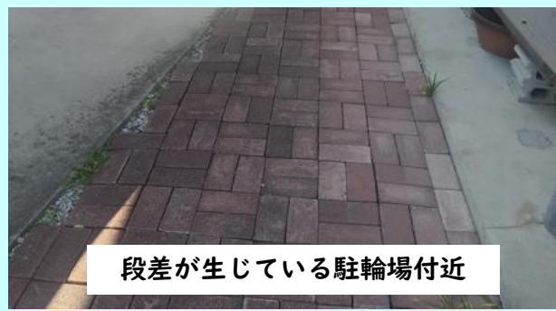
段差が生じている駐輪場付近

利用者から「駐輪場付近に段差が生じている」との声が届いている。改善が必要ではないか。