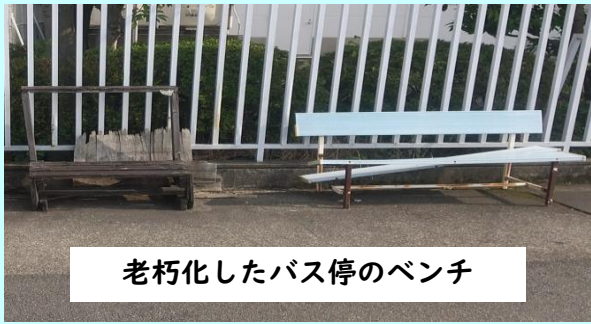
老朽化したバス停のベンチ

バス停へのベンチ設置をおこなうべきでは。 市の回答：設置条件をクリアし、利用者が多いバス停のベンチ設置を検討する。