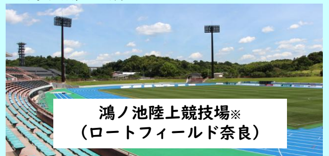
鴻ノ池陸上競技場※ （ロートフィールド奈良）

令和13年度に奈良県で国民スポーツ大会・全国障害者スポーツ大会が開かれる。陸上競技場に大型ビジョン（電光掲示板）を設置すべきでは。