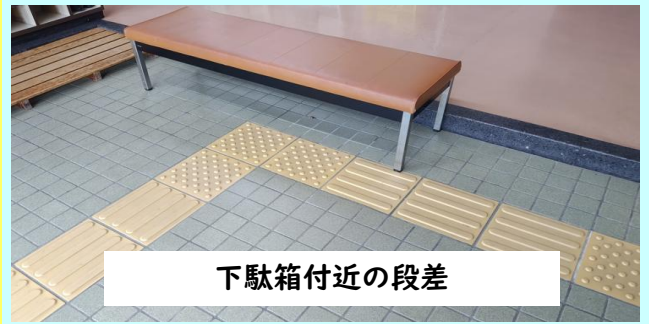
下駄箱付近の段差

公民館の下駄箱付近など、依然、段差が残っている。改善すべきでは。 市の回答：効果的な手法を検討し、段差解消を図っていく。