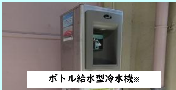
ボトル給水型冷水機※

冷水機が設置されている小学校は少ない。熱中症対策として、ボトル給水型冷水機（水筒に直接水を注ぐ冷水機）を小学校に設置すべきでは。