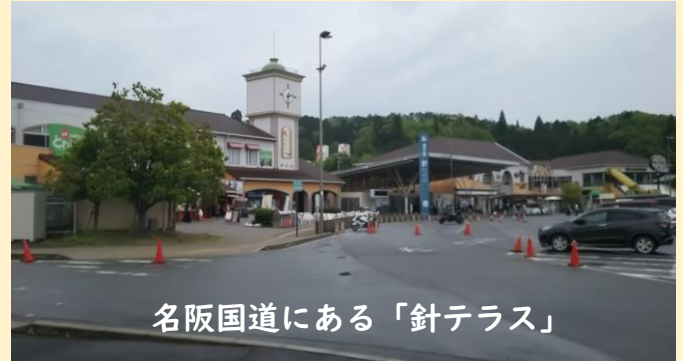
名阪国道にある「針テラス」

令和12年4月新施設供用開始予定となっています。どのような施設になるのか、改めてお伝えさせていただきます。