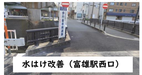
水はけ改善（富雄駅西口）