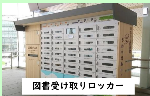
図書受け取りロッカー

近鉄大和西大寺駅南北自由通路内および、近鉄学園前駅隣接の西部会館内に「図書受取ロッカー」が設置されています。ぜひ、ご利用ください。