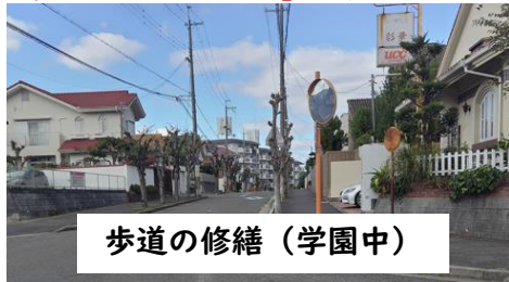
歩道の修繕（学園中）

「何とかならない？」の声をいただいて、地域の方々の協力を得て、改善しました（令和6年4月以降改善）