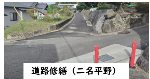
道路修繕（二名平野）

他にも「何とかならない？」との声をいただいています。改善に向けて1つ1つ対応してまいります。