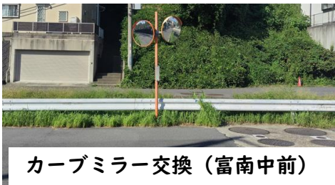
カーブミラー交換（富南中前）