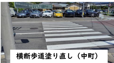
横断歩道塗り直し（中町）