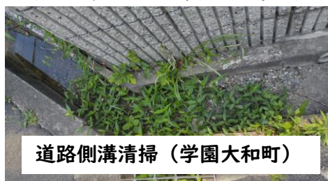
道路側溝清掃（学園大和町）