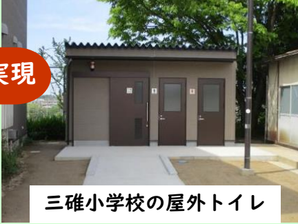
三碓小学校の屋外トイレ