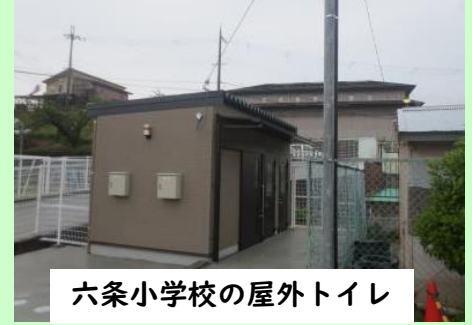
六条小学校の屋外トイレ