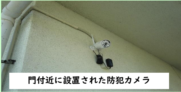
門付近に設置された防犯カメラ

本年6月議会にて、公立の幼稚園、保育所、こども園での、外部からの侵入を防ぐ対策として、門への防犯カメラの設置などを求めておりましたが、2つの園に防犯カメラが設置されました。今後、他園の門への防犯カメラ設置についても、 早期設置 を求めてまいります。