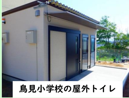
鳥見小学校の屋外トイレ