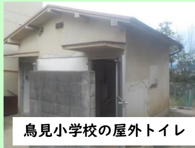
鳥見小学校の屋外トイレ