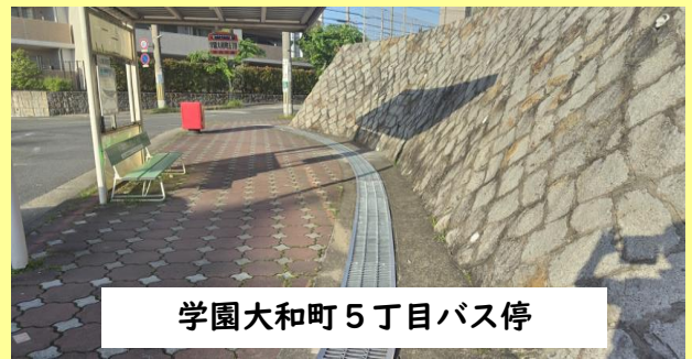
学園大和町5丁目バス停

学園大和町5丁目バス停の歩道には、側溝があり、危険との声をいただき、対応していましたが、グレーチング（溝蓋）が設置されました。