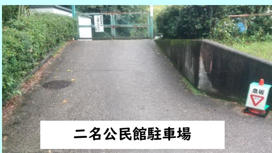
二名公民館駐車場