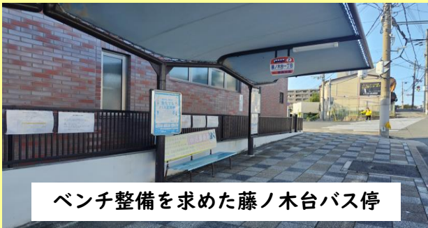
ベンチ整備を求めた藤ノ木台バス停

令和4年6月議会において、バス停のベンチ整備を求めましたが、再度、早期のバス停のベンチ整備実施を求めました。