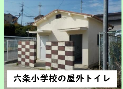
六条小学校の屋外トイレ