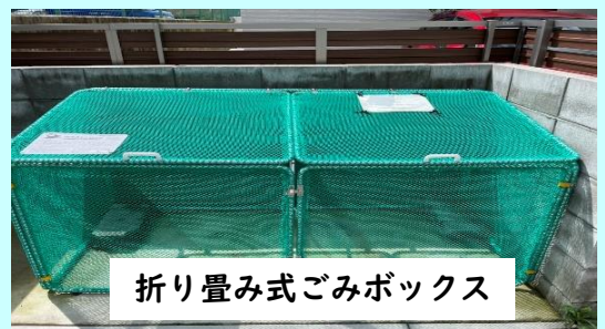
折り畳み式ごみボックス

より一層ごみの減量化に取り組む必要があることから、ごみの減量化に取り組む地域に対して、折り畳み式ごみボックスの購入補助やインセンティブ付与をしてはどうか