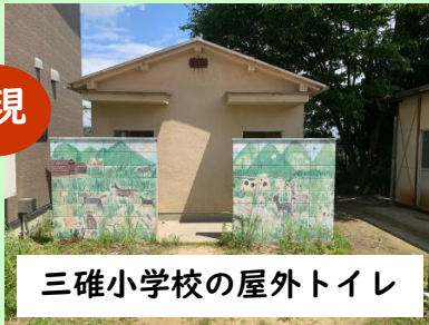
三碓小学校の屋外トイレ