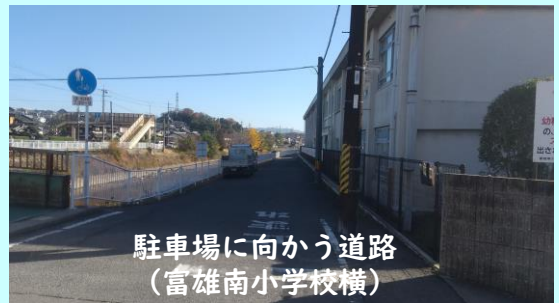
駐車場に向かう道路 （富雄南小学校横）

保護者の方から、園から駐車場の間には、照明器具がなく、暗くて危険との声が寄せられている。早期に改善が必要ではないか。