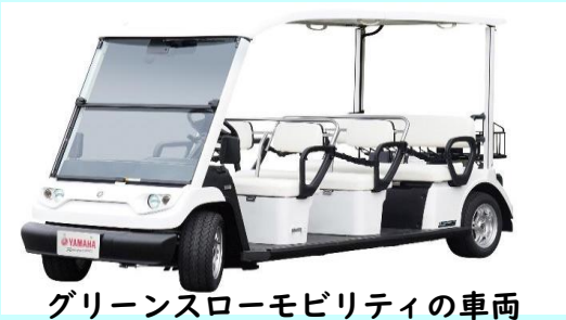
グリーンスローモビリティの車両

高齢者の方から、移動支援を求める声が大きくなっている。ゴルフのカートのような車を活用した、グリーンスローモビリティによる実証実験をおこなってはどうか。