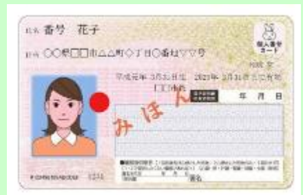
マイナンバーカード

奈良市内117店舗 (セブンイレブン37店、ローソン36店、ファミリーマート42店、ミニストップ2店)