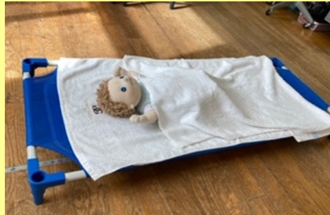
子ども用簡易ベット（イメージ写真）

しかし、【私立】の保育所等への導入予算は提案されていません。【私立】の保育所等へも、子ども用簡易ベットを導入するよう、市長に要請書を提出しました（8月）